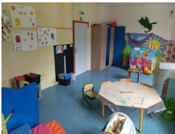
Salle d'activité des 3-5 ans