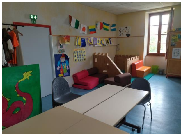
Salle d'activité des 6-11 ans

Nous disposons également d'un accès direct à la médiathèque.